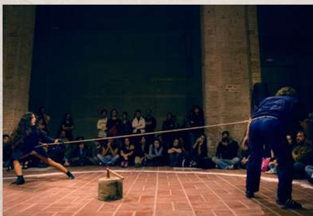
“GALLO 3” / COLECTIVO UN CORMORÁN

Son en varios proyectos, tanto personales como compartidos, que recorro al medio audiovisual, ya que siento poder expresarme cómodamente también desde él, pudiendo dar lugar a otras narrativas, juegos y dimensiones. “Santa Eva”, “Toma de Posesión”, “Ver lo que Veo”.