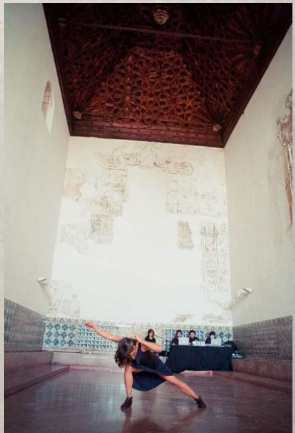
“ASOMARSE AL VACÍO”