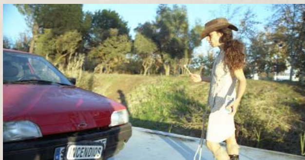
“ENCARNI VIVA” / SANTA EVA

Son en varios proyectos, tanto personales como compartidos, que recorro al medio audiovisual, ya que siento poder expresarme cómodamente también desde él, pudiendo dar lugar a otras narrativas, juegos y dimensiones. “Santa Eva”, “Toma de Posesión”, “Ver lo que Veo”.