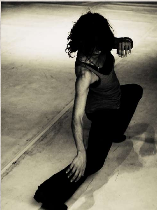
“LA FRACTURA DEL TIEMPO”

El poner al servicio de lo común y compartido el acto creativo, pudiendo a través del mismo establecer otras formas de relación, presencia y expresión entre las personas me resulta clave en nuestro desarrollo humano y social. Nutrirnos de experiencias posibles en el despertar de la sensibilidad, es un blando al que miro.