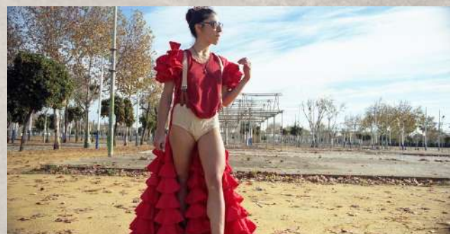
““MANOLETE”/ SANTA EVA

La mayoría de las creaciones han sido realizadas para espacios no convencionales, en tanto que la vinculación con el público junto al espacio abierto y la arquitectura, son elementos de soporte a la vez que inspiradores en el momento de la muestra.