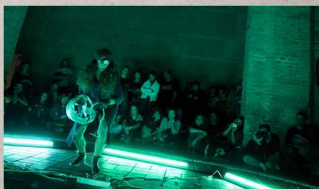
“GALLO 3” / COLECTIVO UN CORMORÁN