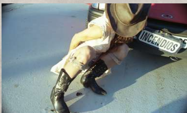
“ENCARNI VIVA” / SANTA EVA

Colectivo Un Cormoran o Le Lucciole son algunos de ellos.