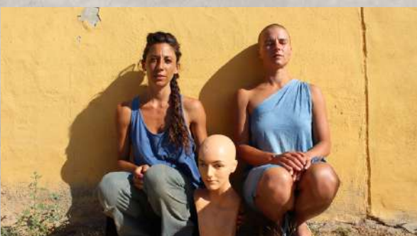
““VER LO QUE VEO”

La literatura, la filosofía y la poesía son fuentes de las que bebo. La Naturaleza es un eje indispensable del que me nutro a más no poder, así como el ser humana y nuestro estar en el mundo de la vida.