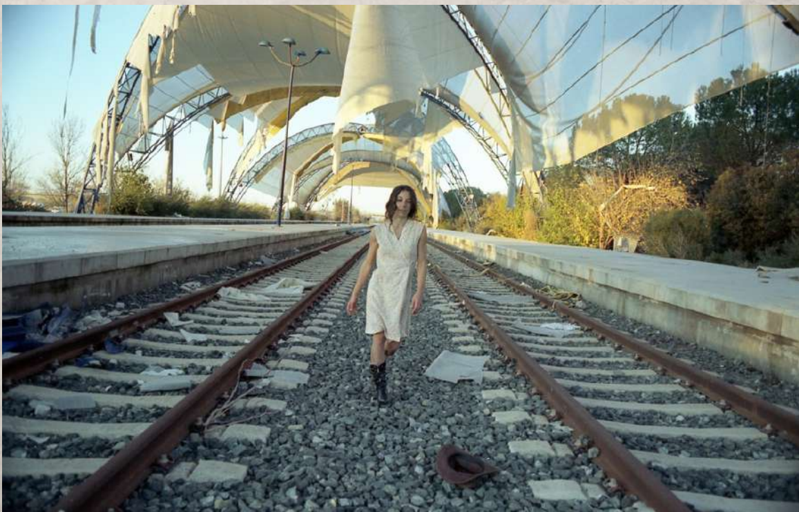
“ENCARNI VIVA” / SANTA EVA