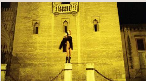
“DUÉRMETE NIÑA, DUÉRMETE YA” / SANTA EVA

En general, las piezas creadas hasta el momento son de formato corto, no superan los 30'. A nivel de elementos tienden a ser despojadas y crudas, aunque no siempre. La conjugación cuerpo, espacio, sonoridad suele ser la base.